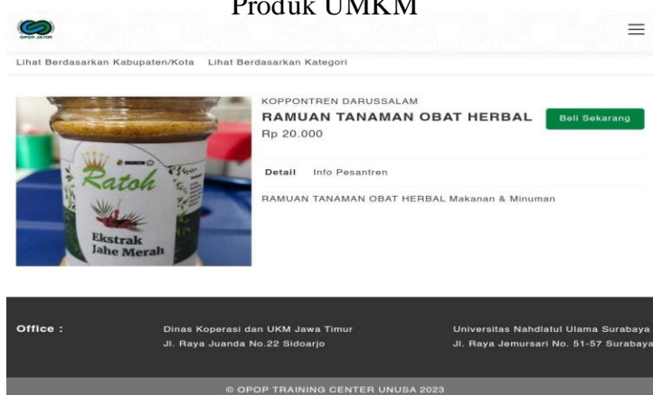
Gambar 2. Produk UMKM

Pertama kali memproduksi hanya terdapat satu jenis produk yaitu ekstrak jahe merah baik berupa bubuk ataupun cair, khusus produk yang bahan bakunya dari jahe karena yang dikenal oleh masyarakat jahe merupakan salah satu sumber daya alam dan sumber pendapatan yang ada di desa dan lebih ampuh untuk mengobati Covid-19 , kemudian dengan berkembangnya waktu mengolah semua bahan-bahan rempah yang ada di desa tersebut. Pengelolaan produk tersebut dikelola secara manual dengan alat dapur seadanya seperti blender, wajan, kompor tanpa menggunakan alat mesin yang modern. Hal tersebut merupakan salah satu kendala yang dihadapi oleh pelaku usaha dan hambatan lain produk tersebut masih dipasarkan melalui pemasaran manual seperti dijual di KOPONTREN, Apotek bahkan pada saat masyarakat gotong royong, karena produk ini tidak dapat bertahan lama.