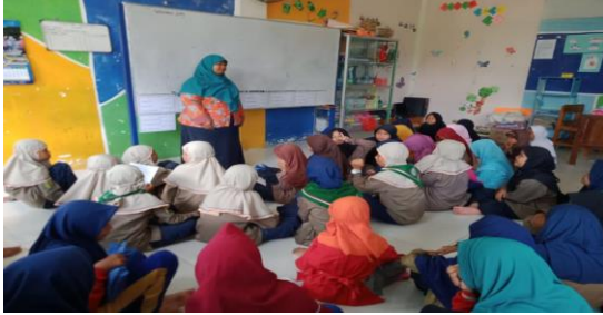
Gambar 4. Kajian Keputrian

biasanya kalau hari Jum'at itu ada kajian keputrian, sambil menunggu anak laki-laki sholat Jum'at berjama'ah, dari kajian itu kita belajar aturan seorang perempuan menurut agama Islam." 22