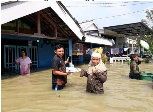
Gambar 3. Kegiatan Bakti Sosial

pada pukul 07.00 sampai pukul 16.00, pembelajarannya berakhir pada jam 14.00, dan sisanya digunakan untuk pengembangan minat dan bakat siswa melalui kegiatan ekstrakurikuler. Ekstrakurikuler disini ada Hizbul Wathon, panahan, tapak suci, melukis, menari, english fun , tahfiz, dan futsal. Hari efektif pembelajarannya dari hari Senin sampai dengan Jum'at. Bentuk budaya religius yang diterapkan di SD Muhammadiyah 1 Menganti meliputi sholat dhuha berjamaah, sholat dhuhur dan ashar berjamaah, ngaji morning , tahfiz juz 30, peringatan hari besar Islam (PHBI), berjabat tangan dan mengucapkan salam kepada ustad dan ustadzah saat memasuki sekolah, pembiasaan berinfak, puasa sunnah sebelum Hari Raya Idul Adha, dan bakti sosial. Dalam bakti sosial ini biasanya beberapa siswa dan guru terjun langsung ke tempat yang terkena musibah, seperti beberapa bulan yang lalu, beberapa siswa dan guru melakukan bakti sosial kepada korban banjir di Desa Boboh, hal-hal seperti itu kami biasakan untuk menumbuhkan sikap tolong menolong pada siswa." 17