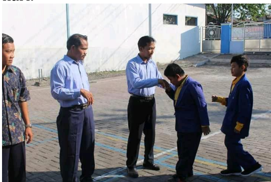
Gambar 1. Pembiasaan Jabat Tangan dan Mengucapkan Salam

biasakan siswa-siswi untuk senyum, salam, sapa, sopan, dan santun. Selain itu, kami juga membiasakan siswa untuk sholat berjama'ah, sholat dhuha, dhuhur, ashar, juga sholat Jum'at, setelah sholat dhuha dilanjut ngaji morning , dan tahfiz juz 30, kegiatan ini dilaksanakan setiap pagi sebelum anak-anak masuk ke kelas. Ada juga kajian Kamis pagi, kajiannya berupa tausiyah ustad/ustadzah berisi kisah keteladanan Nabi, agar anak-anak dapat meneladani para Nabi dengan cara meneruskan sunnah dan anjurannya, salah satunya seperti kegiatan sholat berjama'ah yang sudah dilakukan setiap hari." 11