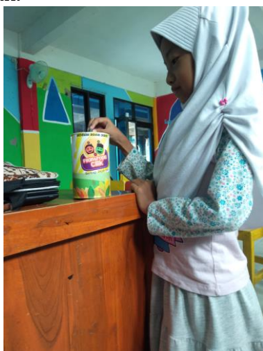
Gambar 2. Pembiasaan Berinfaq

"Full day school di SD Muhammadiyah 1 Menganti hanya untuk kelas 3 sampai kelas 6 saja, jadi untuk kelas 2 pembelajarannya dimulai jam 7 pagi dan diakhiri jam 12 siang, bagi siswa yang mengikuti ekstra pulang jam 2 siang. Full day school disini dikemas untuk mengembangkan dan memberikan penguatan dalam hal keagamaan pada siswa, seperti rajin beribadah. Untuk sehari-hari kegiatan siswa di sekolah diawali dengan sholat dhuha berjama'ah di dalam kelas, kemudian dilanjutkan dengan ngaji morning , dan tahfiz/hafalan juz 30, target tahfidz di kelas 2 yaitu menghafalkan surat Abasa dan At-Takwir. Di sekolah kami juga mengadakan program filantropis cilik untuk membiasakan siswa gemar berinfaq, saling tolong menolong, dan bersikap dermawan. Jadi program filantropis ini mengajak siswa untuk menyisihkan sebagian uang sakunya untuk diinfaqkan kepada saudara yang kurang mampu, dalam program ini setiap siswa mendapatkan satu kaleng, siswa diarahkan untuk mengisi kaleng tersebut semampunya, dan setiap satu bulan sekali disetorkan kepada pihak sekolah." 15